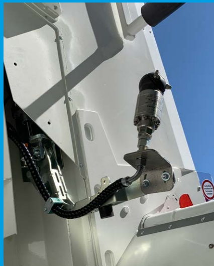
Seitliche, ausklappbare Wascharme